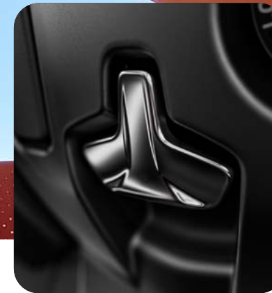
NUOVO FRENO DI STAZIONAMENTO