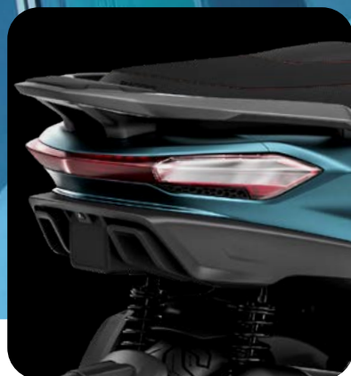
NUOVO DESIGN DALLE LINEE ULTRAMODERNE