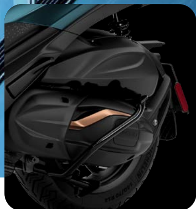
NUOVO MOTORE DA 530 CC EURO 5