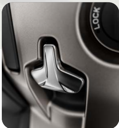
NUOVO FRENO DI STAZIONAMENTO