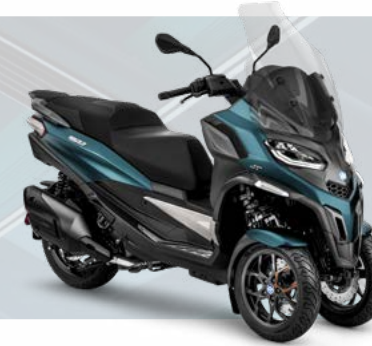
BLU OXYGEN MATT