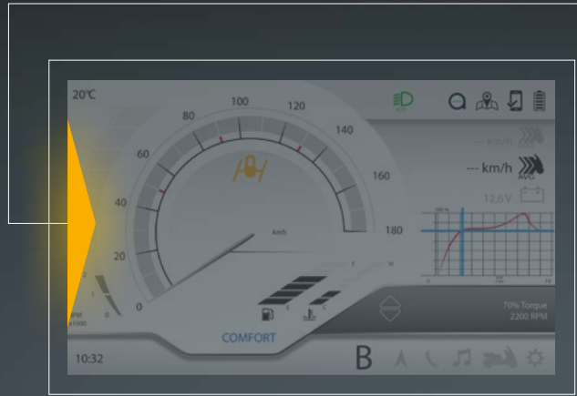
BLIS - BLIND SPOT INFORMATION SYSTEM