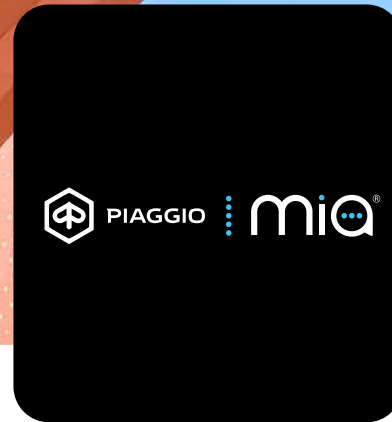
CONNETTIVITÀ EVOLUTA CON PIAGGIO MIA ON BOARD