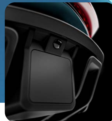
RETROMARCIA E TELECAMERA POSTERIORE