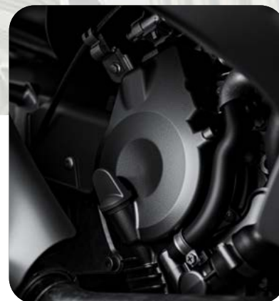
MOTORE EURO 5