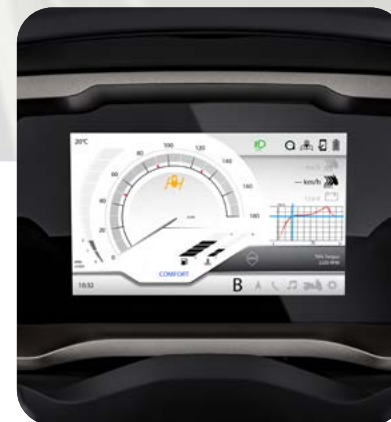
STRUMENTAZIONE CON DISPLAY DIGITALE TFT DA 7"