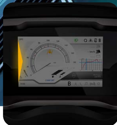
BLIND SPOT INFORMATION SYSTEM