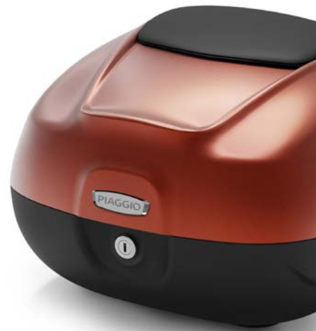
BAULETTO 37 l