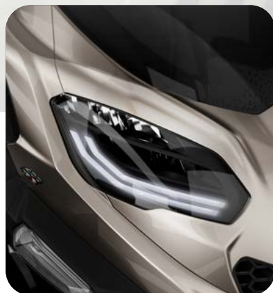
SISTEMA DI ILLUMINAZIONE FULL LED