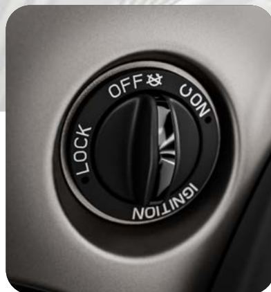
NUOVO SISTEMA KEYLESS