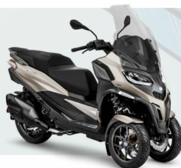
GRIGIO CLOUD MATT