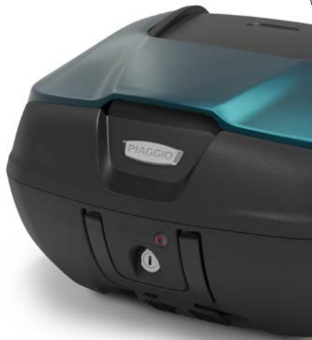
BAULETTO 52 l