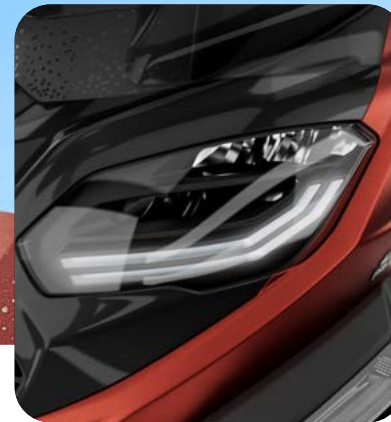
NUOVI FARI LED DRL