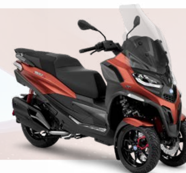
ARANCIO SUNSET MATT